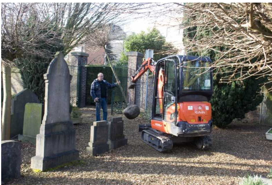
De graafmachine kon net naar binnen (millimeter werk!)

Vervolg van: Begraafplaats: Gemeente Sittard-Geleen vervangt dode Acer