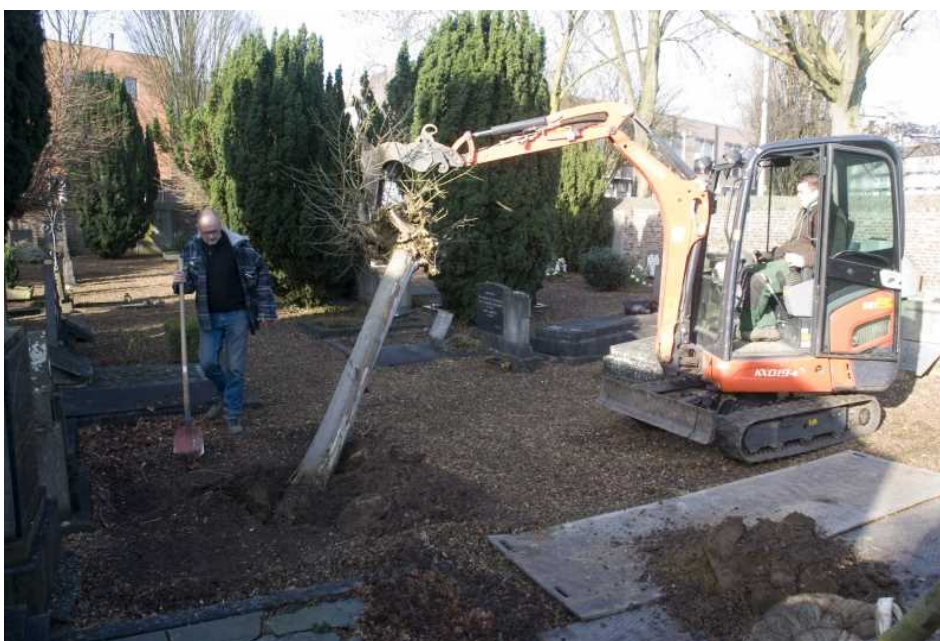
De dode boom was er zo uit.