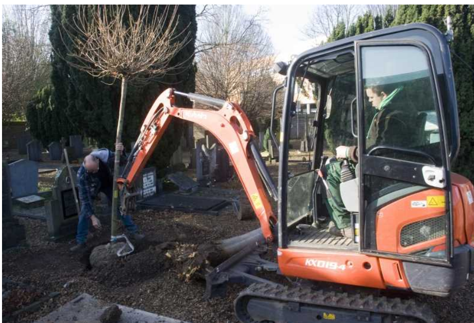
De nieuwe er in.

Vervolg van: Begraafplaats: Gemeente Sittard-Geleen vervangt dode Acer